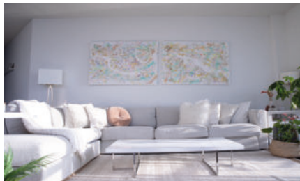
Verspachteln, ausmalen und schon fertig.