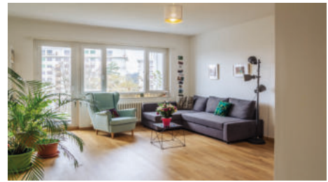
Weg mit den alten Radiatoren! Eine Wandheizung/Kühlung ist die Lösung.